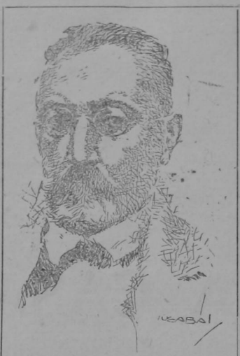
Don Miguel de Unamuno

Posiblemente, un buen día, en esa caleta de Puerto de Cabras que sirve de alberca a Unamuno y Soriano: esa humilde caleta que está encerrada entre la cárcel y la Iglesia, entre la explotación y la penitencia—también entre el error y la verdad y entre el dolor y el consuelo—se verá sobre una de las ventanas una lápida, en la que las generaciones futuras puedan leer esta leyenda: "Aquí se escribió, para gloria de España, en el año de 1924." Podríamos denominar, asimis-