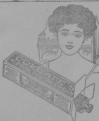
Tipo de belleza italiana dibujado por un artista nativo.